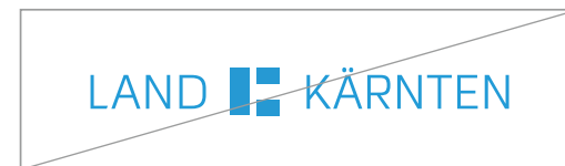
Ganzes Logo farblich verändern