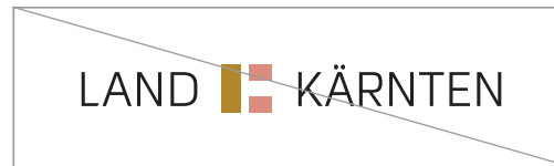
Abändern der vordefinierten Logofarben

Die definierten Farben und Schriften dürfen nicht verändert werden!