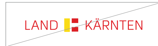
Teile des Logos farblich verändern