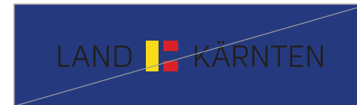
Schwarzes Logo auf dunklen Grund stellen