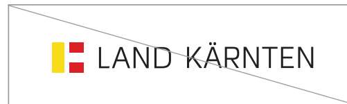
Teile des Logos verändern